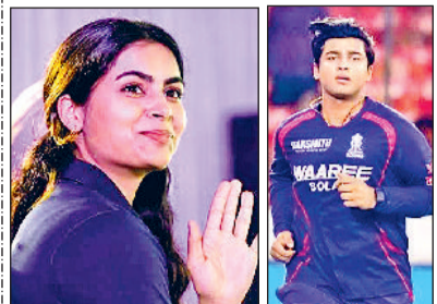
नई दिल्ली। भारत की स्टार निशानेबाज मनु भाकर से युवा क्रिकेटर वैभव सूर्यवंशी पर पूछा गया एक सवाल सोशल मीडिया पर बड़ी बहस का कारण बन गया। दिल्ली में नेशनल राइफल एसोसिएशन ऑफ इंडिया के 75वें स्थापना समारोह के दौरान प्रकरों ने मनु से 15 वर्षीय क्रिकेट प्रतिभा वैभव सूर्यवंशी को लेकर राय मांगी। मनु भाकर ने बेहद संतुलित और प्रेरणादायक जवाब दिया। उन्होंने कहा, 'अगर मार्गदर्शन अच्छा हो, उसके

आसपास सही लोग हों और उसे सही दिशा मिले, तो उस रिस्क एक संख्या है। प्रतिभा की कोई उम्र नहीं होती। बड़ी उपलब्धियां 60 साल में भी मिलती हैं और छह साल में भी। अगर उसे सही मेंटरशिप मिली, तो वह अगला बड़ा स्टार बन सकता है।