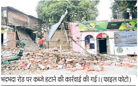
भदभदा रोड पर कब्जे हटाने की कार्रवाई की गई। (फाइल फोटो)