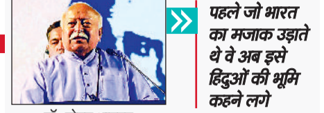
डॉ. मोहन भागवत

पहले जो भारत का मजाक उड़ाते थे वे अब इसे हिंदुओं की भूमि कहने लगे