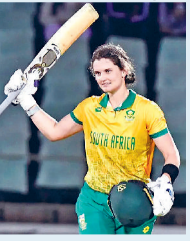
एजेसी ▶▶ दुबई